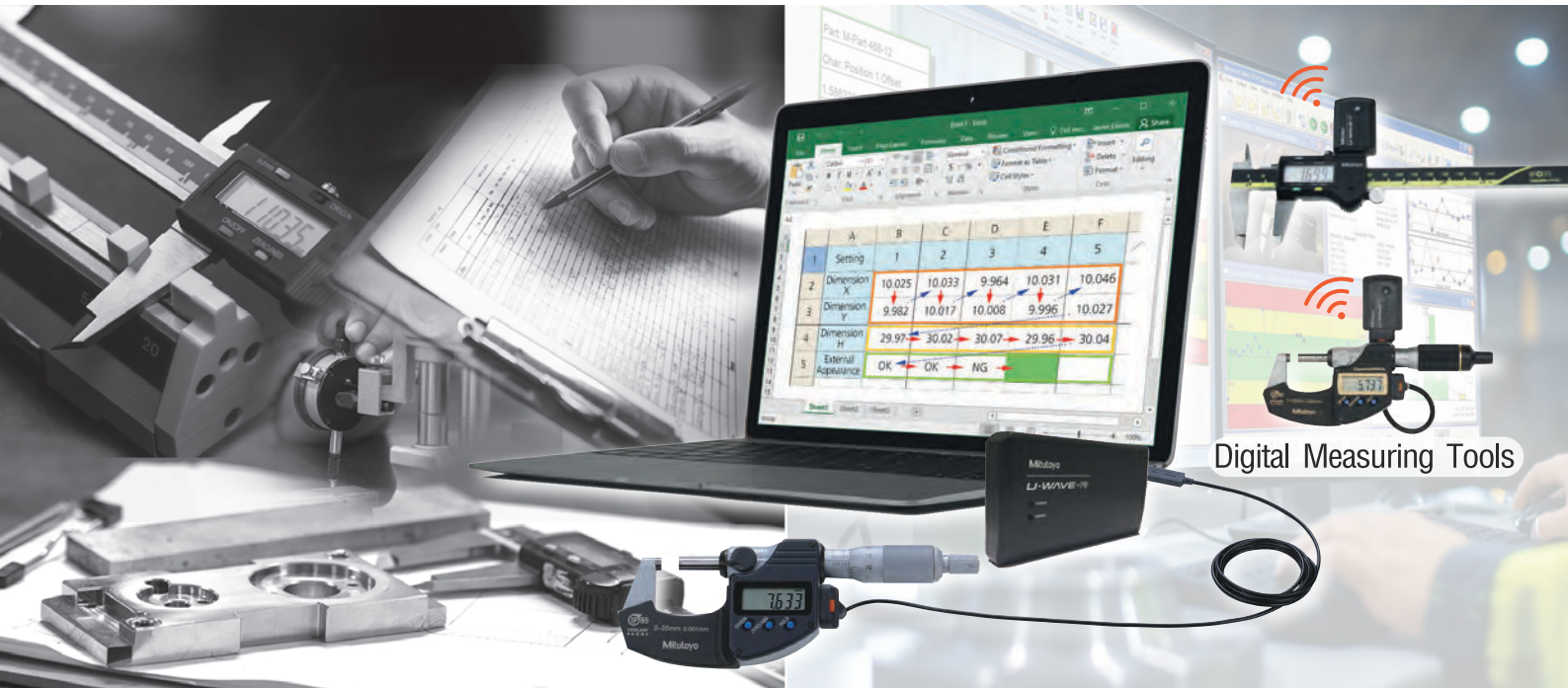
Digital Measuring Tools

ประหยัดเวลาและลดความผิดพลาดในการบันทึกข้อมูล นำมาประมวลผลและจัดทำรายงานเพื่อการวิเคราะห์ได้อย่างมีประสิทธิภาพ